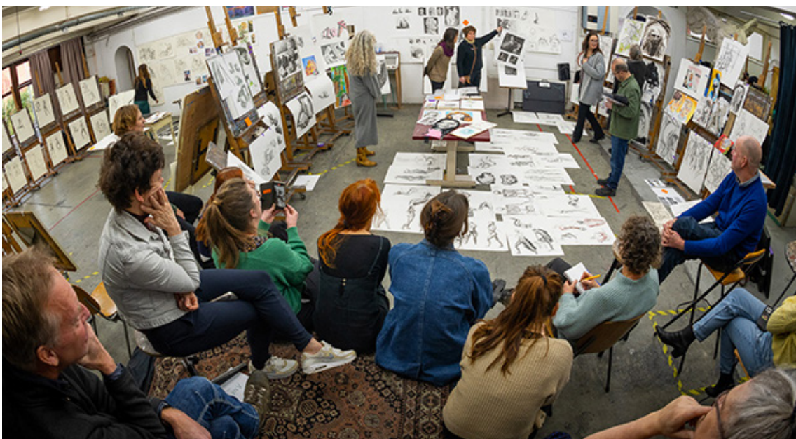
WERKBESPREKING VAKSCHOLING 1