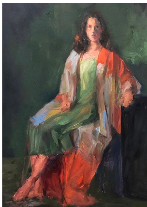
LINKS CURSUS PORTRETSCHILDEREN 1E SEMESTER, RECHTS MODELSCHILDEREN 2E SEMESTER