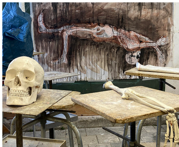
PROJECTEN: LINKS 'LEVENSROOT MODELSCHILDEREN' MET ARTHUR STOKVIS EN RECHTS 'SKELETTEN' MET ROBIN SHILLCOCK