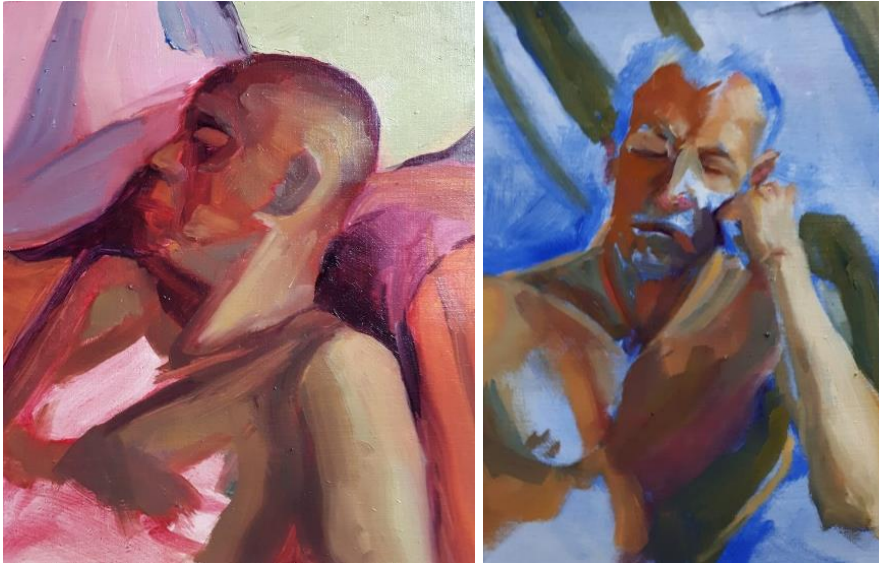
Twee werken van Alma Ficchi, Master 1.