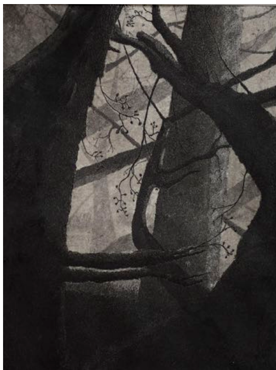
Master 1 Maya Post, grafiek.