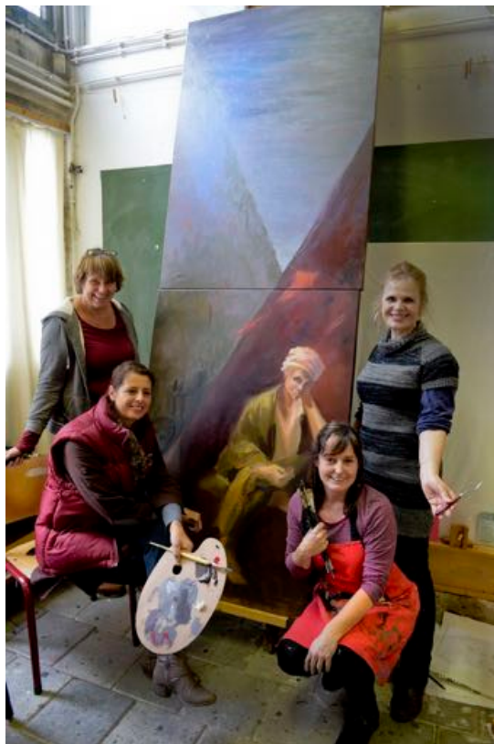
Academiebrede projecten Vakscholing 1, 2 en 3 Drents Museum nav tentoonstelling Peredvizhniki.