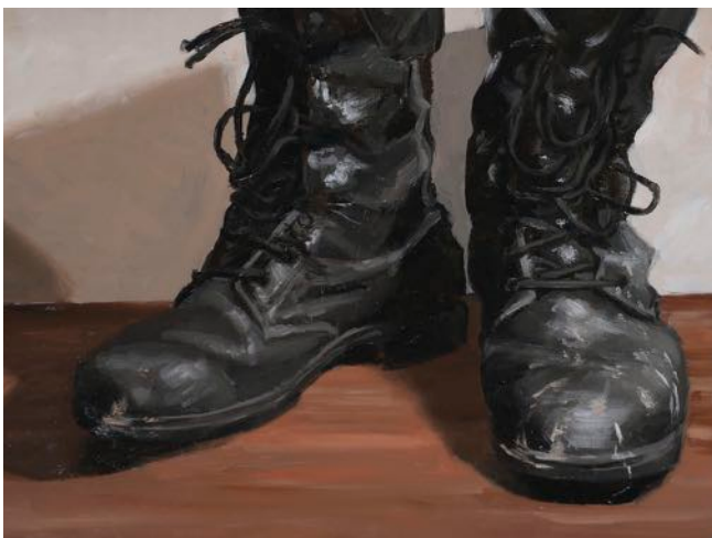
Vakscholing 2 Marlisa Simonis.