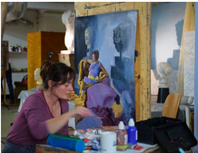
Academiebrede projecten Vakscholing 1, 2 en 3 Alma Tadema Project Fries Museum.